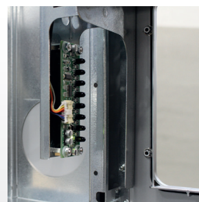
Fotocellule riconoscimento bicchieri fino a 3 altezze diverse